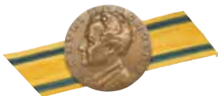
Katri Bergholm -mitali

Sotilaskotiansioristiä kannetaan nauhassa muiden kunniamerkkien tapaan, sotilaskoti-asussa myös nauhalaattana. Sotilaskotiansioristiä voidaan kantaa myös siviiliasussa.